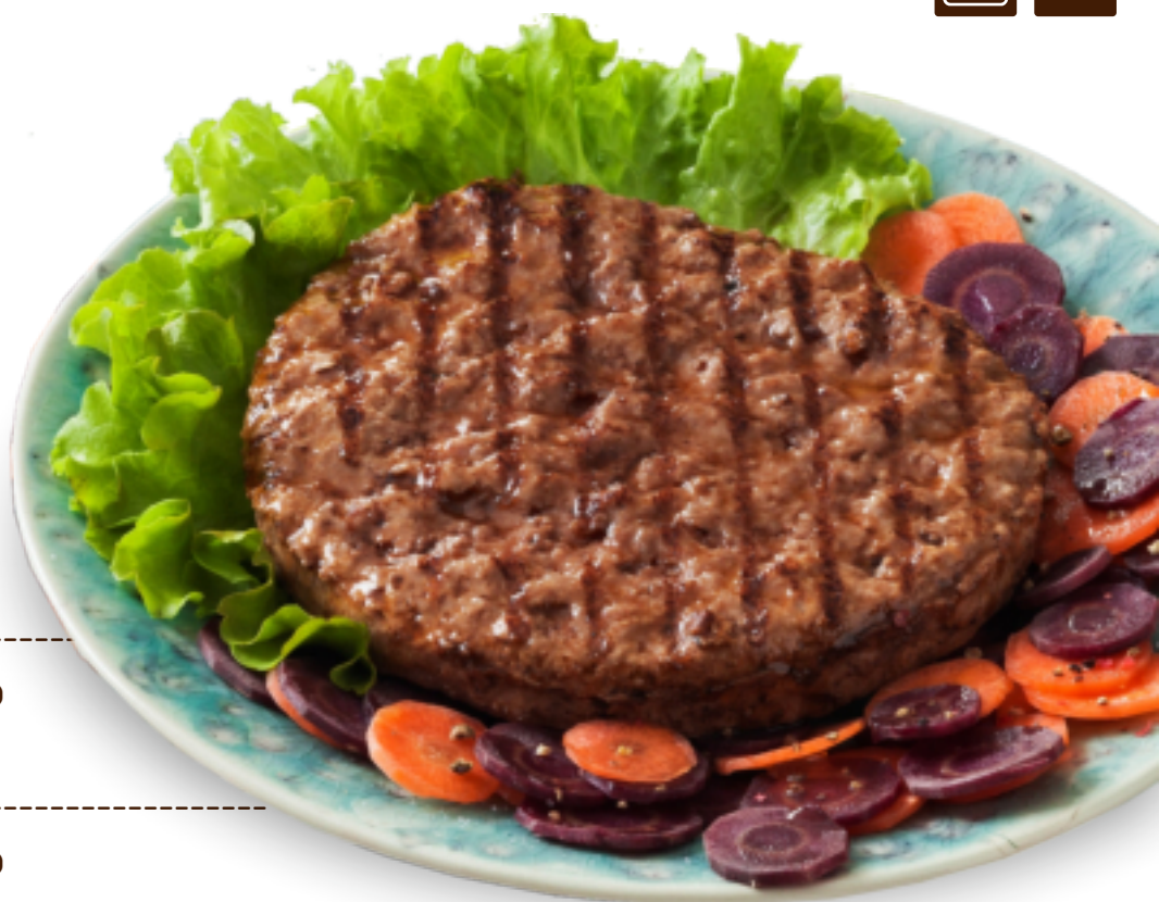
Hamburger Maxi Grigliato gr. 200 x10 GC 2704

Un'esclusiva per un prodotto fuori misura (è da 230 gr. a crudo). Ottimo nel piatto, ma straordinario nel panino Giant per un piatto USA da urlo. Da scongelare a microonde e passare in tostiera prima di essere servito.