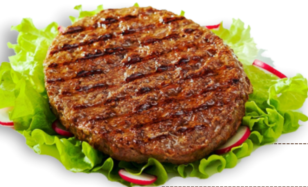
Hamburger Devil gr. 75 x26 GC 2306